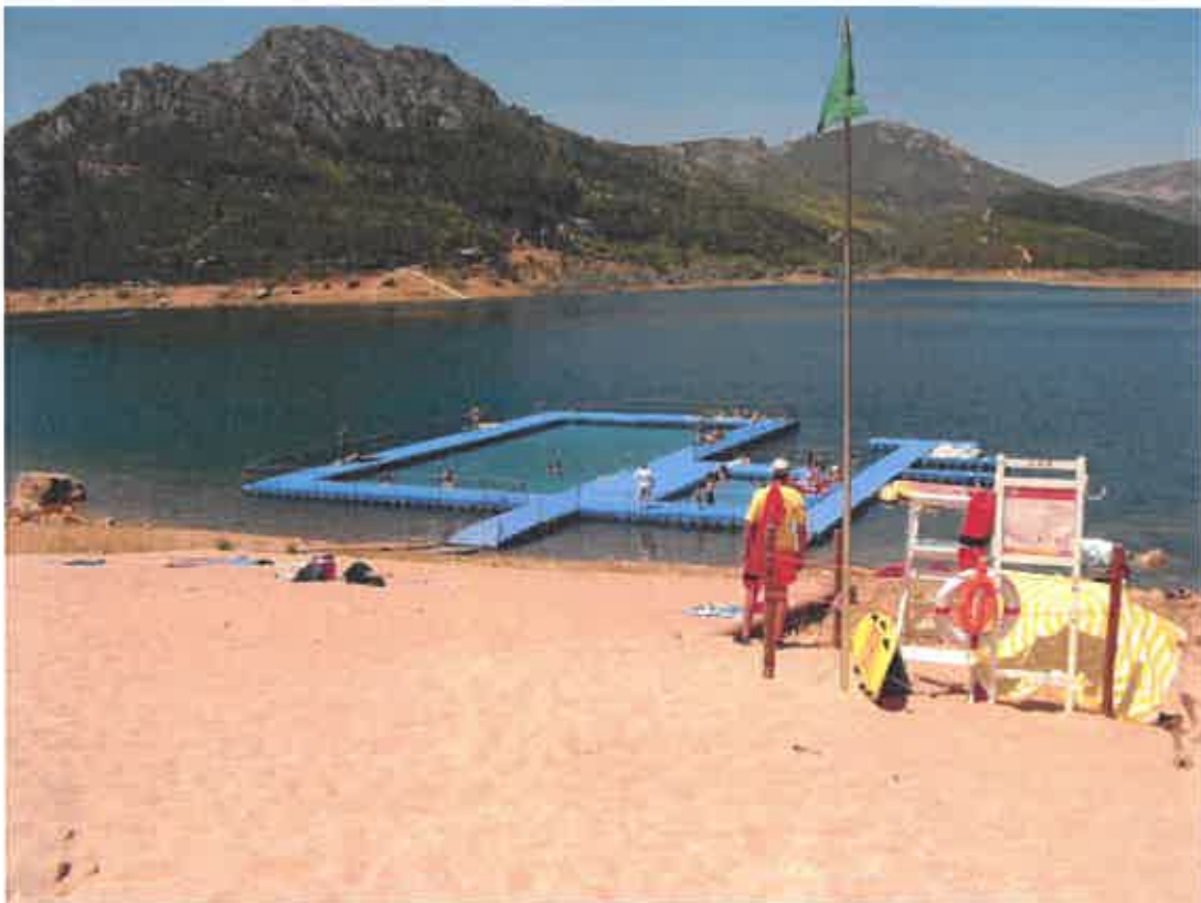
F_01 (Posto de vigla da praia)